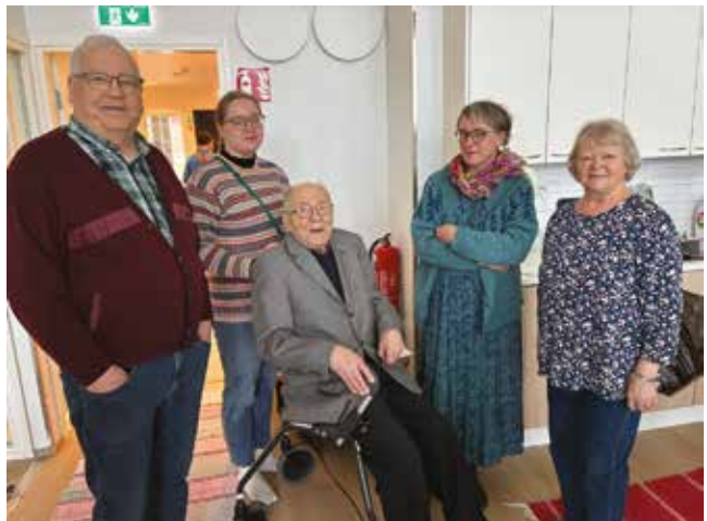
Lauantaina 25.4. oli avoimet ovet jonka aikana taloon kävi tutustumassa yli 50 ihmistä, joiden joukossa entisiä työntekijöitä ja nuoria, naapureita ja työn tukijoita sekä useita muita (ylh, ja alla).