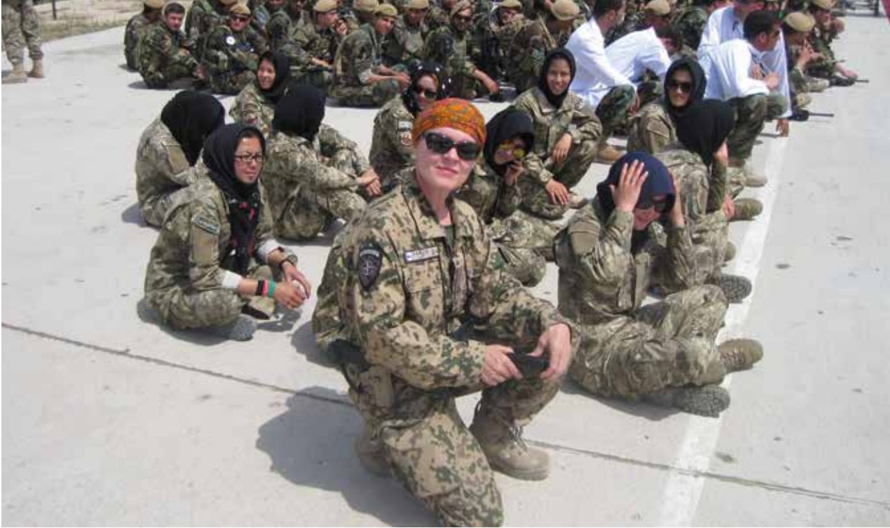
Ensimmäinen naisten ja miesten yhteinen valmistumisjuhla Ktah Ktas-yksikössä Kabulissa 1. kesäkuuta 2016.

tarvikkeita kouluihin, ruokaa ja vaatteita moniin eri kohteisiin. Monen paikallisen lapsen, mummon, papan, äidin, isän ja kollegan jalat pysyivät lämpiminä äitini kutomissa villasukissa.