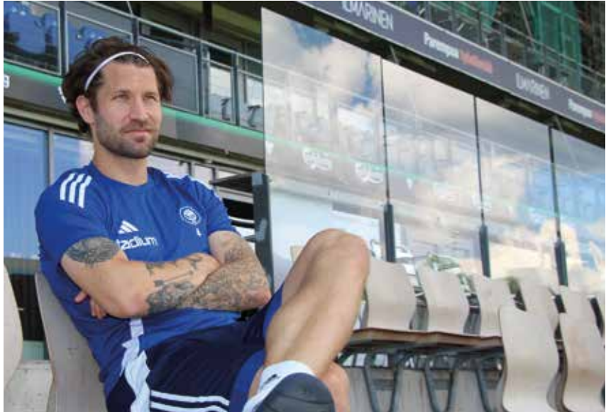
Entinen maajoukkueen kapteeni Joono Toivio on nykyään Helsingin Jalkapalloklubin eii HJK:n kapteeni.

- Sanotaan, että se huokuu ja välittyy joukkueeseen, kun valmentaja haluaa keskustella ja tehdä asioita yhdessä. Se vahvistaa joukkueen uskoa itseensä. Eikä niin, että johtava henkilö päättää kaikesta keskustelematta pelaajien kanssa. Se on tärkeää, että pelaajilla on usko siihen, mitä ollaan tekemässä ja miten. Tulee tunne, että mielipiteitä kuunnellaan.