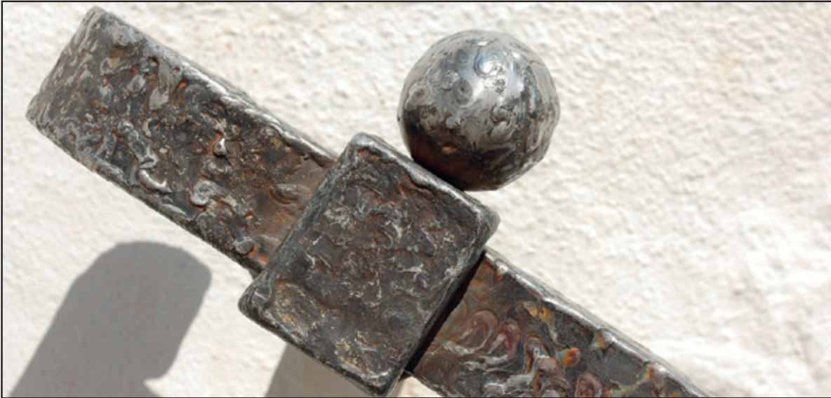
Sepän pajasta tämäkin. Osa Johanneksen ilmestysluolan porraskaidetta Patmokselta.

Kun meitä ajoittain saatellaan ahjoihin ja outoihin maisemiin, voivat saattelijoina olla kipeät asiat. Kenelle ne ovat toisia ihmisiä. Kenelle sairauksia, syviä murheita, omien syntien polte ja omaan parannukseen pettyminen. Kenelle se on suoranaisten synti, johon lankesi ja joka pudotti hengelliseltä jalustalta toisten syntisten joukkoon. Ahjo on oikeasti kuuma. Se polttaa ja sattuu. Se merkitsee häpeää ja kasvojen menettämistä. Mutta tätä tietä anteeksiantava mieli ja armahdettujen syntisten yhteys voivat syventyä. Löytyy toinen ihminen, jonka silmissä on vierailut sama kyynel.