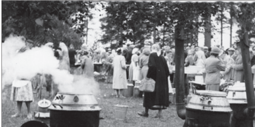
Muistojen kuva. Orpokotijuhlien ruokahuoltoa silloin ennen.