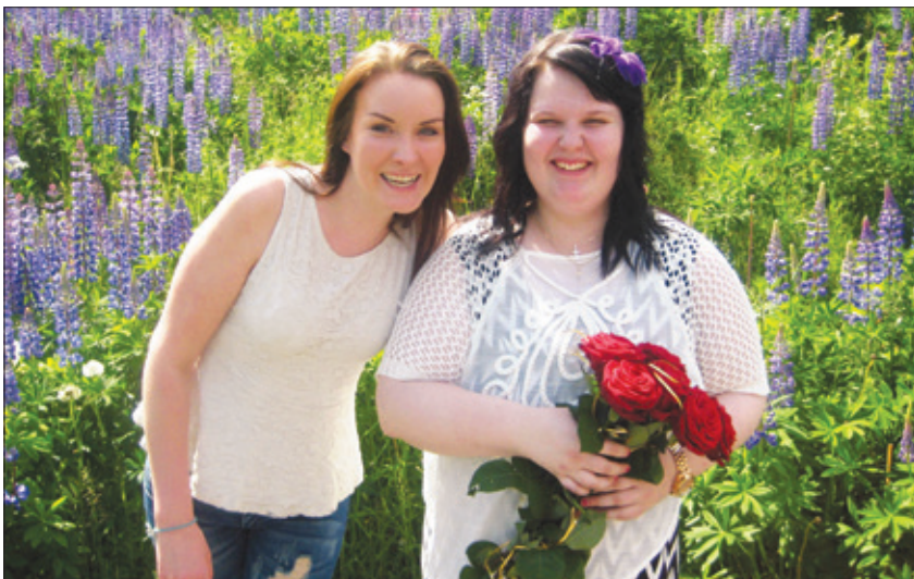
Tiia käy lastenkodilla tapaamassa kasvunkumppaneitaan. Kuva Bellan rippijuhlalta tältä kesältä.

Sanotaan, että Parikanniemessä ollaan yhtä suurta perhettä. Kaikki ovat vähän kuin sisaruksia keskenään. Pariin ystävään pidän edelleen miltei joka päivä yhteyttä, ja näemmekin aika usein. Henkilökuntakin on tullut tosi läheiseksi. Siellä on työntekijöitä, jotka ovat itsekkin sanoneet olevansa kuin vanhempia meille. Kyllä mekin olemme heille tosi tärkeitä.”