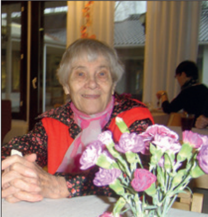
Airaa muistetaan yhteisesti Haminan piirin pikkujoulussa Kulmakivessä ma 16.12. klo 13.