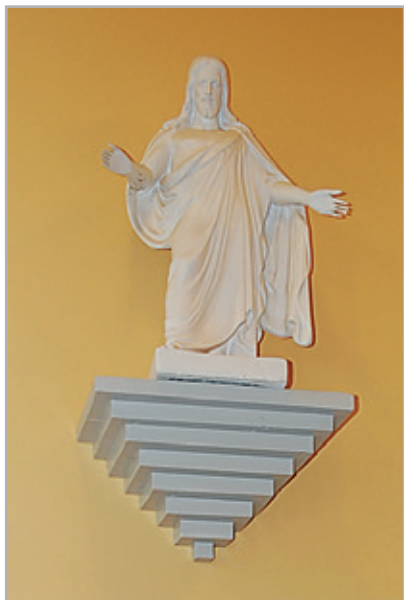
Kristus-patsas Vanha -Tuusjärven salissa.