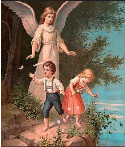
“ Maan korvessa kulkevi lapsosen tie, vaan ihana enkeli kotihin vie”

Jumala”. Hän ottaa vastaan ihmisten Jumalalle lähettämät huokaukset. Jos ihminen pyytää Jumalalta ajallisia ruumiillisia tarpeita, niissä kaikissa välittää Neeriel, niin kuin Jumalan Poika on sielun asioissa välimies. Tosin ajallisissakin asioissa tulee pyytää Isältä ja Herran Jeesuksen ansion nojalla, mutta niiden välittäjä on Neeriel.