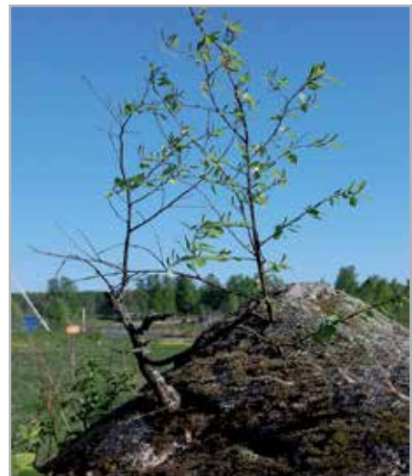
Kaksi versoa samasta kalliosta.